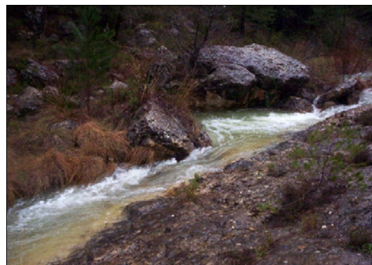
Foto del entorno