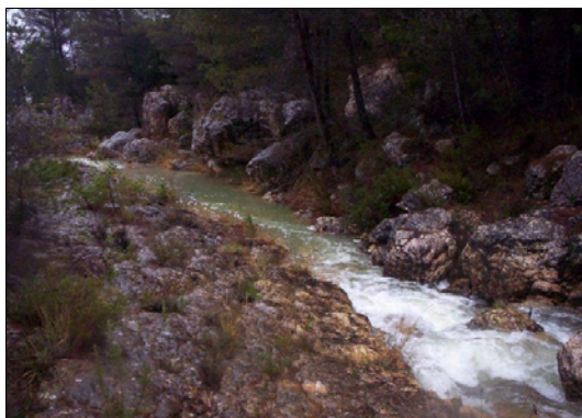
Foto del entorno