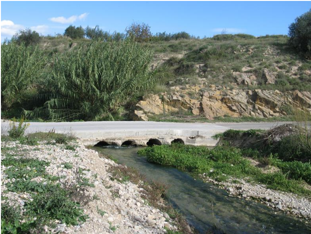
Foto del punto de muestreo

Observaciones: Buen acceso al punto de control.