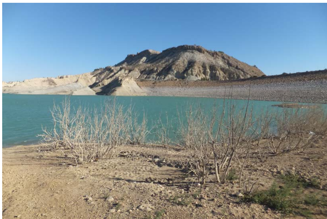
Foto del punto de muestreo