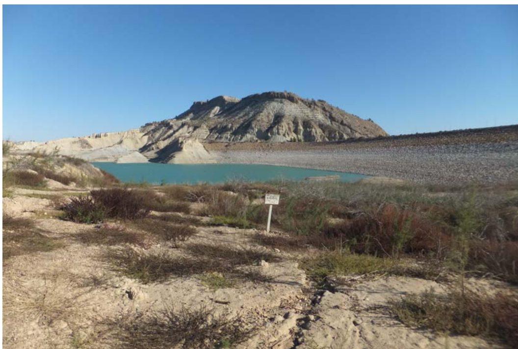
Foto del entorno