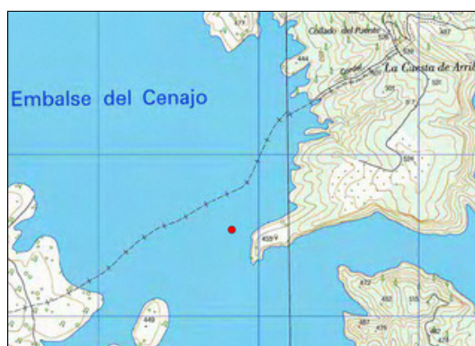
Mapa de situación