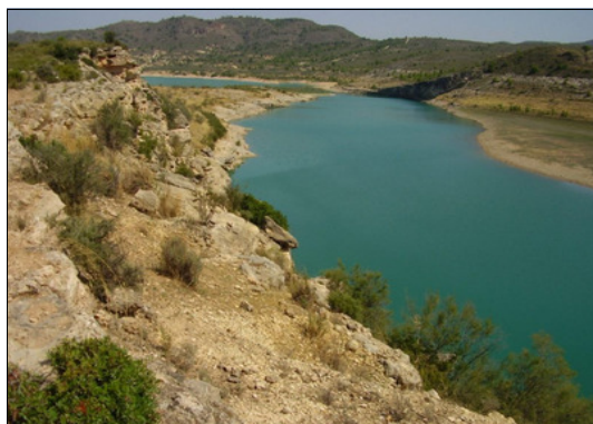
Foto del entorno