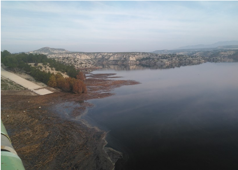
Entorno del punto de control EJU2.