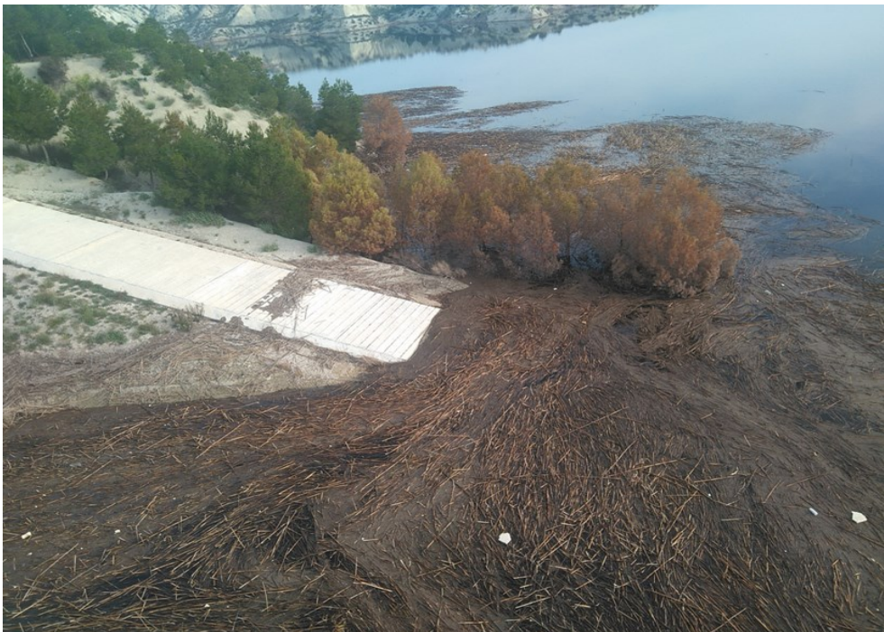
Arrastres acumulados junto a la rampa de acceso al punto de control EJU2.

Observaciones: En el momento de la visita se observaban aún los efectos de las últimas lluvias. Contactar antes con el personal encargado del embalse para el acceso al mismo.