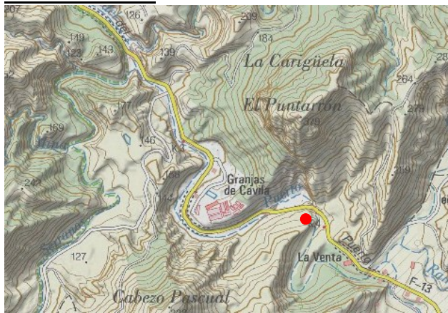
Mapa de situación