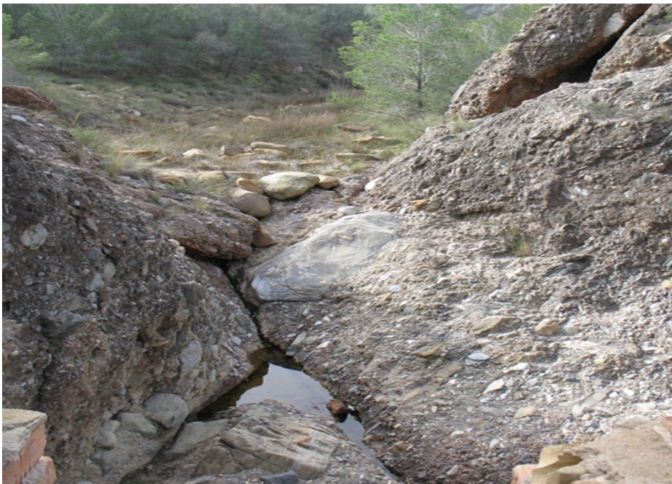
Punto de control GAR1.

Observaciones: Acceso al cauce por la margen derecha del cauce.