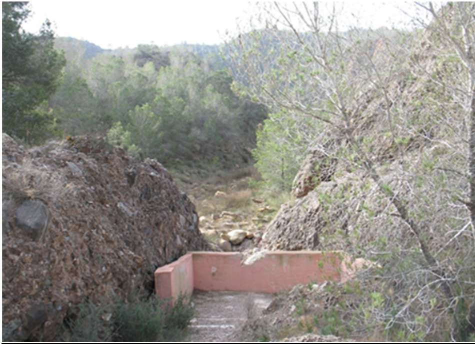
Entorno del punto de control GAR1.