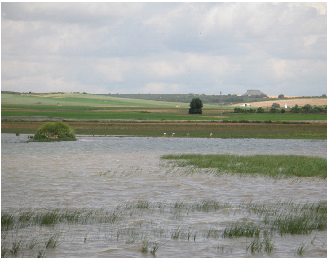
Foto del punto de muestreo