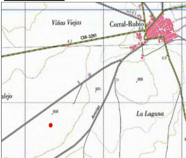
Mapa de situación