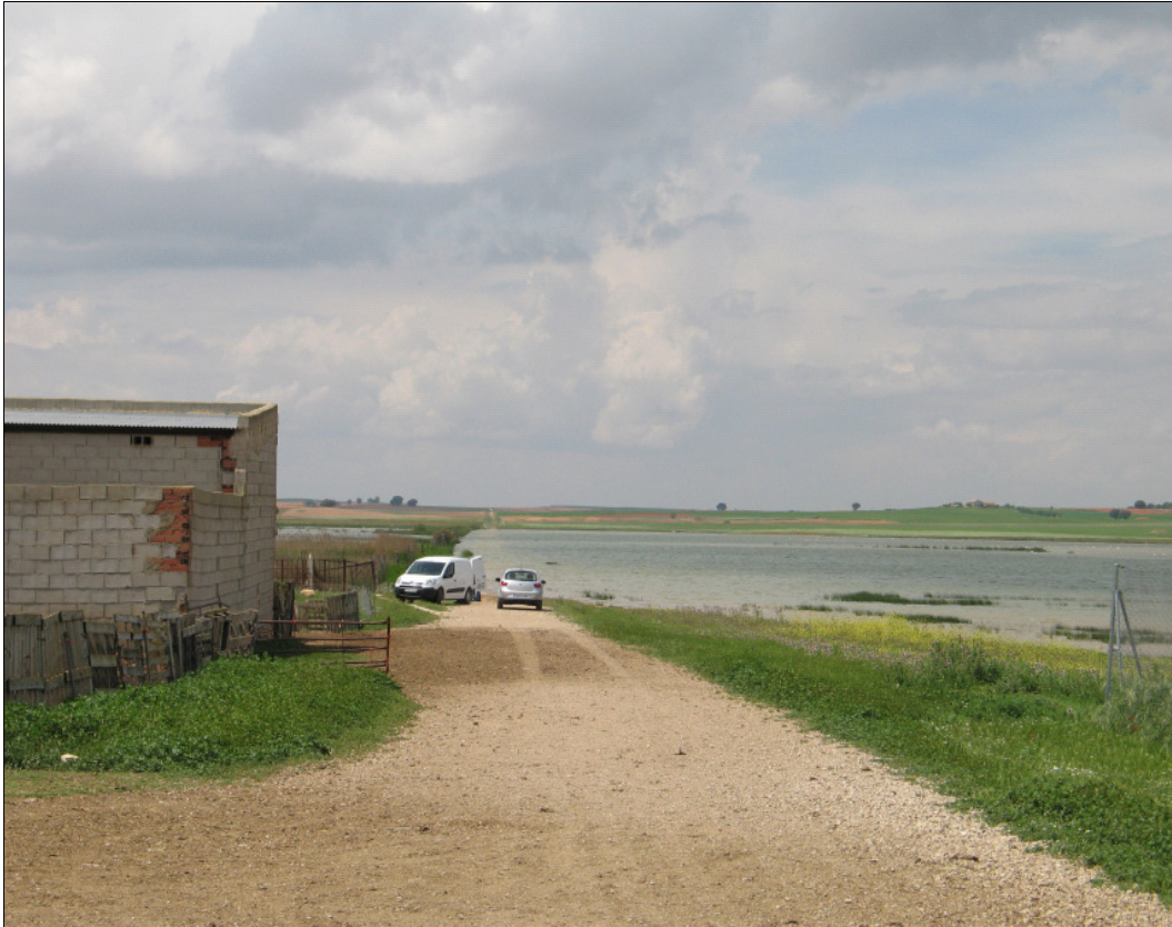
Foto del entorno