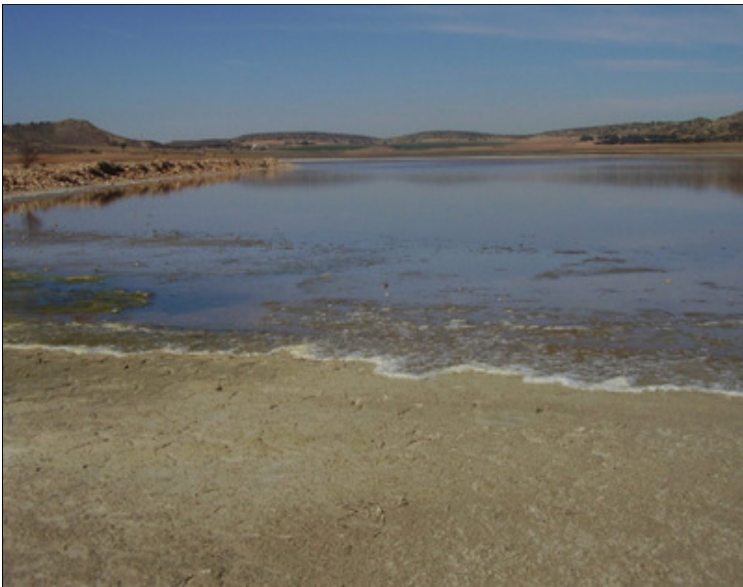
Foto del punto de muestreo