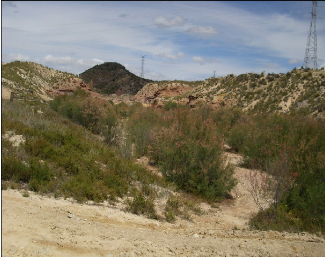
Foto del entorno