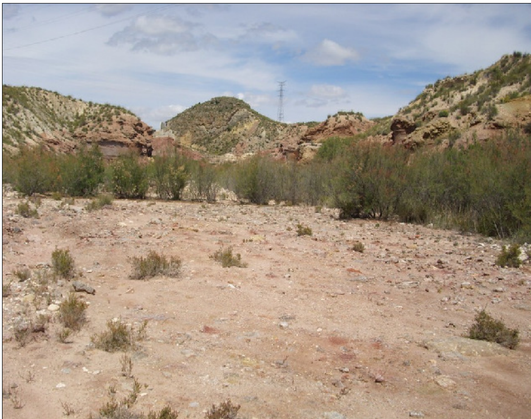
Foto del punto de muestreo