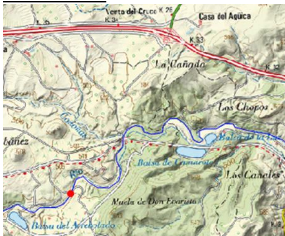
Mapa de situación