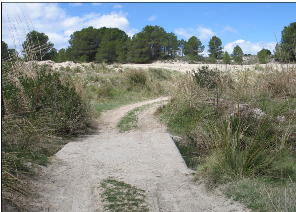
Foto del punto de muestreo