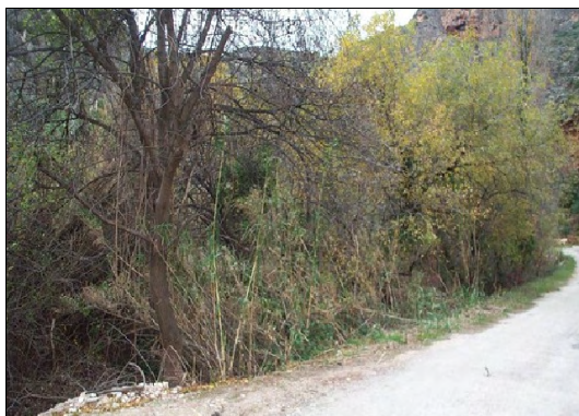
Foto del entorno