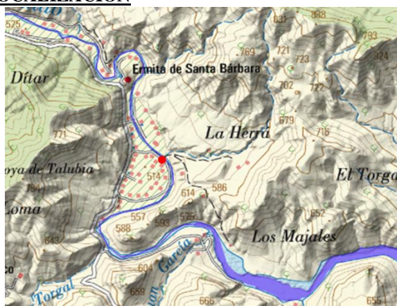
Mapa de situación