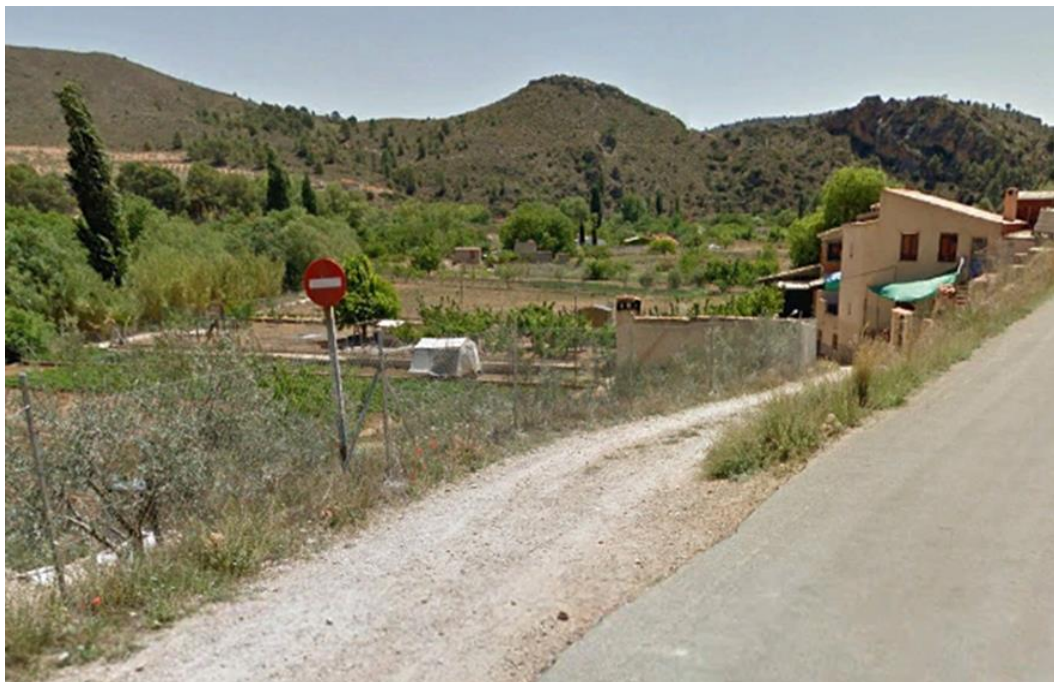
Entorno del punto de control MUN6. Camino de acceso.