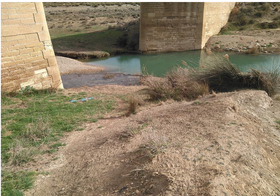
Detalle del punto de control ORT2.

Observaciones: Buen acceso al punto de control. Si ha llovido por la zona, se recomienda utilizar un vehículo todoterreno.