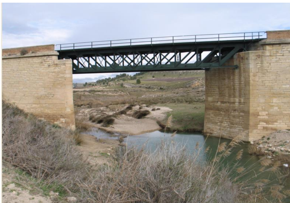
Entorno del punto de control ORT2.