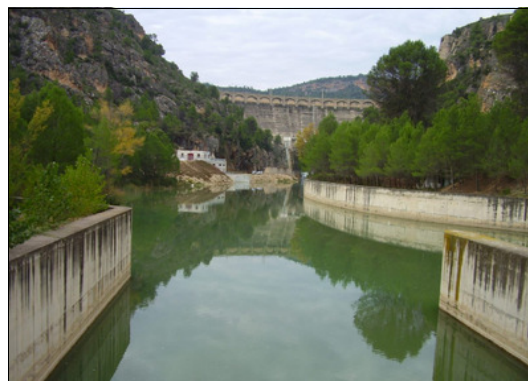
Foto del entorno