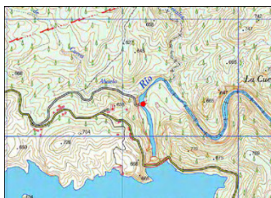
Mapa de situación