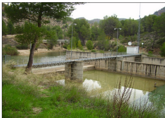
Foto del entorno