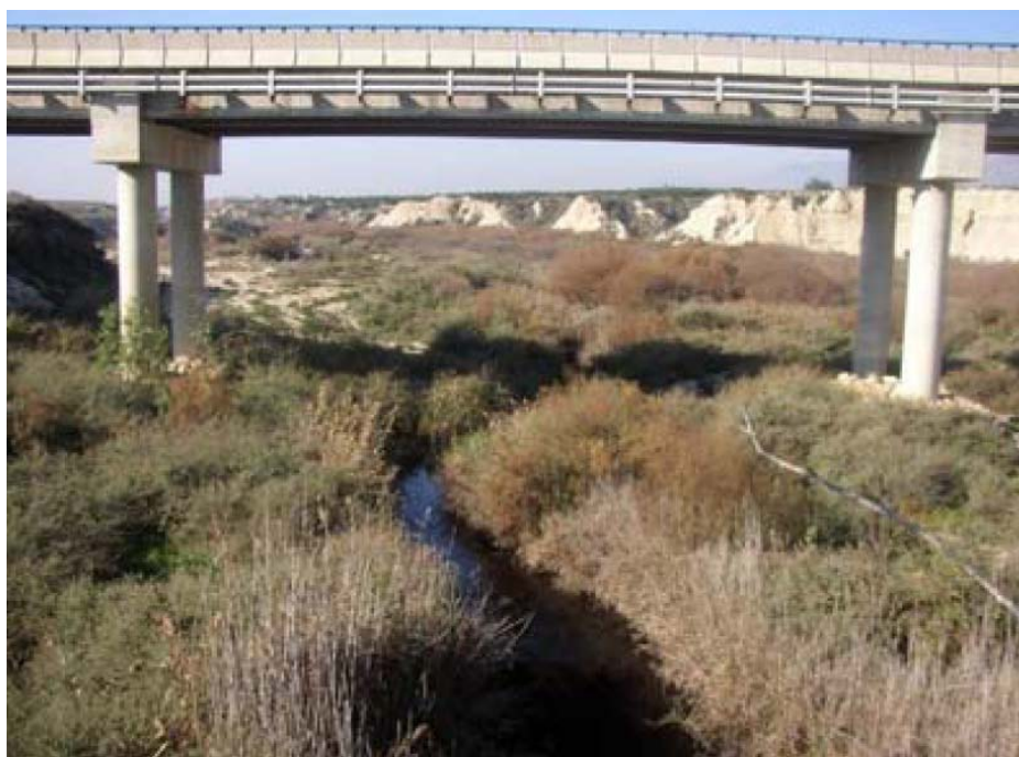
Foto del punto de muestreo

Observaciones: Acceso por el margen derecho.