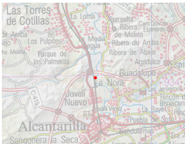
Mapa de situación