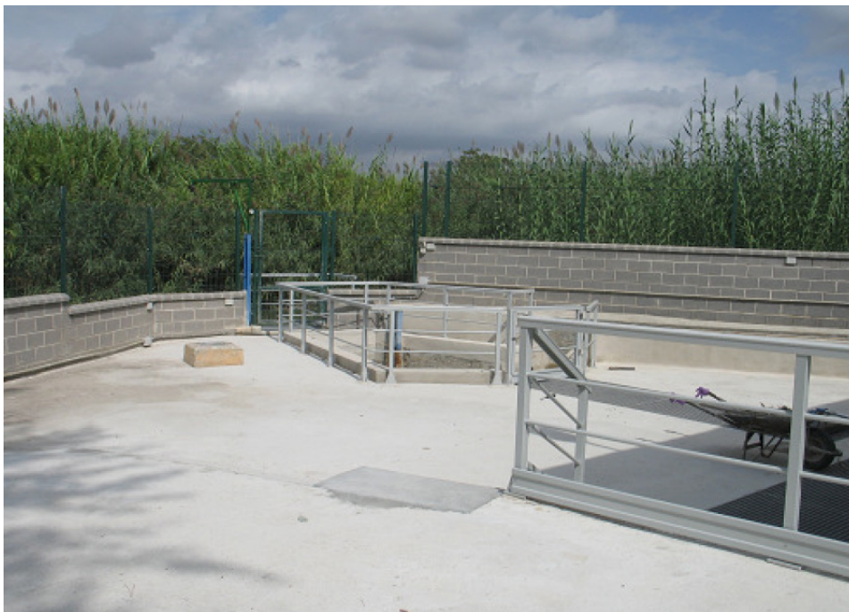
Foto del entorno