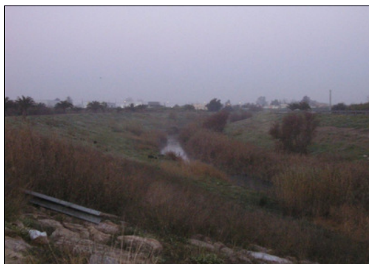
Foto del punto de muestreo