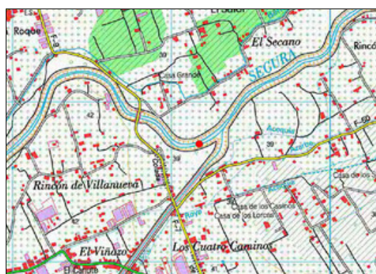
Mapa de situación