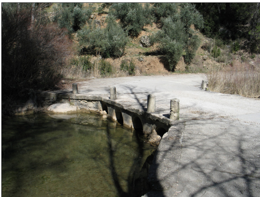
Foto del punto de muestreo

Observaciones: Dado de alta por la posibilidad de sustituir al punto de control SEG2, influenciado por las sueltas de la Central Hidroeléctrica de Miller.