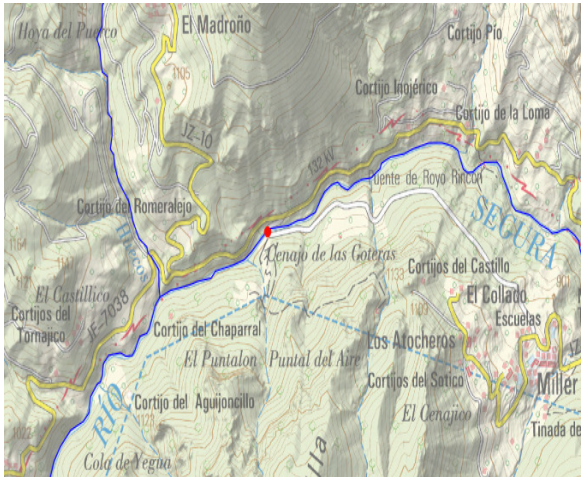
Mapa de situación