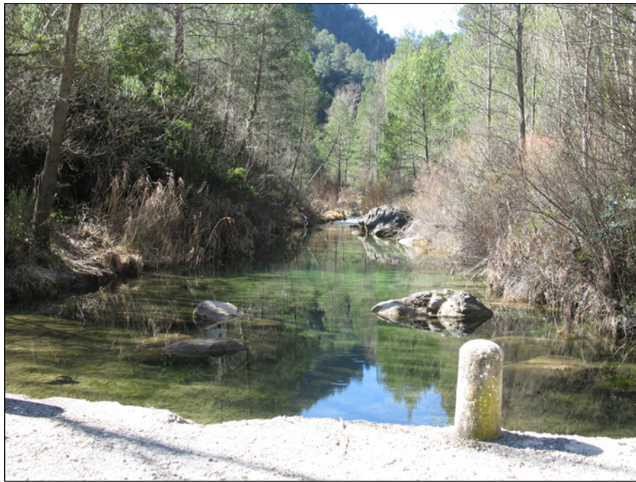
Foto del entorno