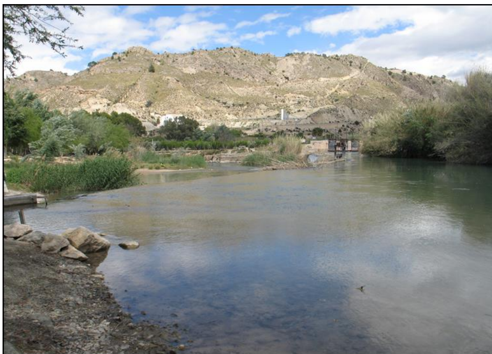
Foto del punto de muestreo