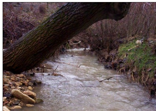
Foto del entorno