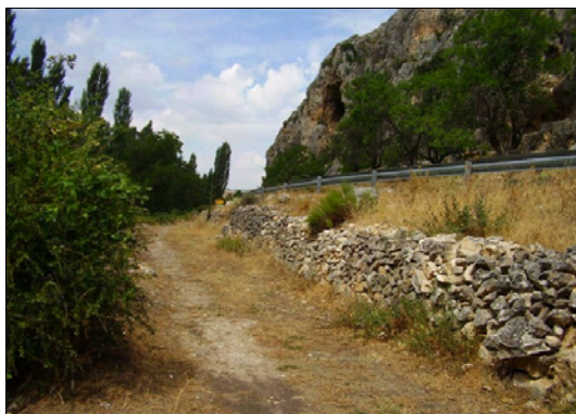
Foto del entorno