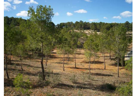
Aspecto de un área forestal recuperada por la CARM en el marco del convenio CHS-CARM

El 26 de diciembre de 2003 se suscribió el CONVENIO DE COLABORACIÓN ENTRE LA CONFEDERACIÓN HIDROGRÁFICA DEL SEGURA Y LA CONSEJERÍA DE AGRICULTURA, AGUA Y MEDIO AMBIENTE DE LA COMUNIDAD AUTÓNOMA DE LA REGIÓN DE MURCIA PARA LA EJECUCIÓN CONJUNTA DE ACTUACIONES DE PROTECCIÓN Y REGENERACIÓN DEL ENTORNO NATURAL , que desarrolló el convenio Marco de Colaboración entre el Ministerio de Medio Ambiente y la Comunidad Autónoma de Murcia sobre actuaciones del Plan Forestal Español.