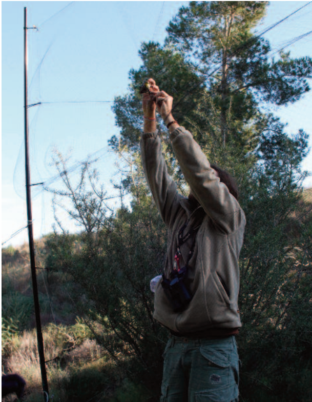
Anillamiento proyecto inv paseriformes forestales.

El objetivo de esta comunicación es evaluar y ejemplificar, desde una perspectiva externa al colectivo de anilladores, la contribución del trabajo de estos a la investigación y formación superior, a través de colaboraciones con profesores e investigadores en ecología y conservación de aves de la Universidad de Murcia. Se reconocen al menos cuatro tipos de actividades (proyectos de investigación, prácticas de campo, trabajos fin de grado y máster, cursillos y talleres de formación) en las cuales el anillamiento científico se erige en una actividad auxiliar fundamental para la investigación y la docencia. Se quieren destacar también las sinergias posi-