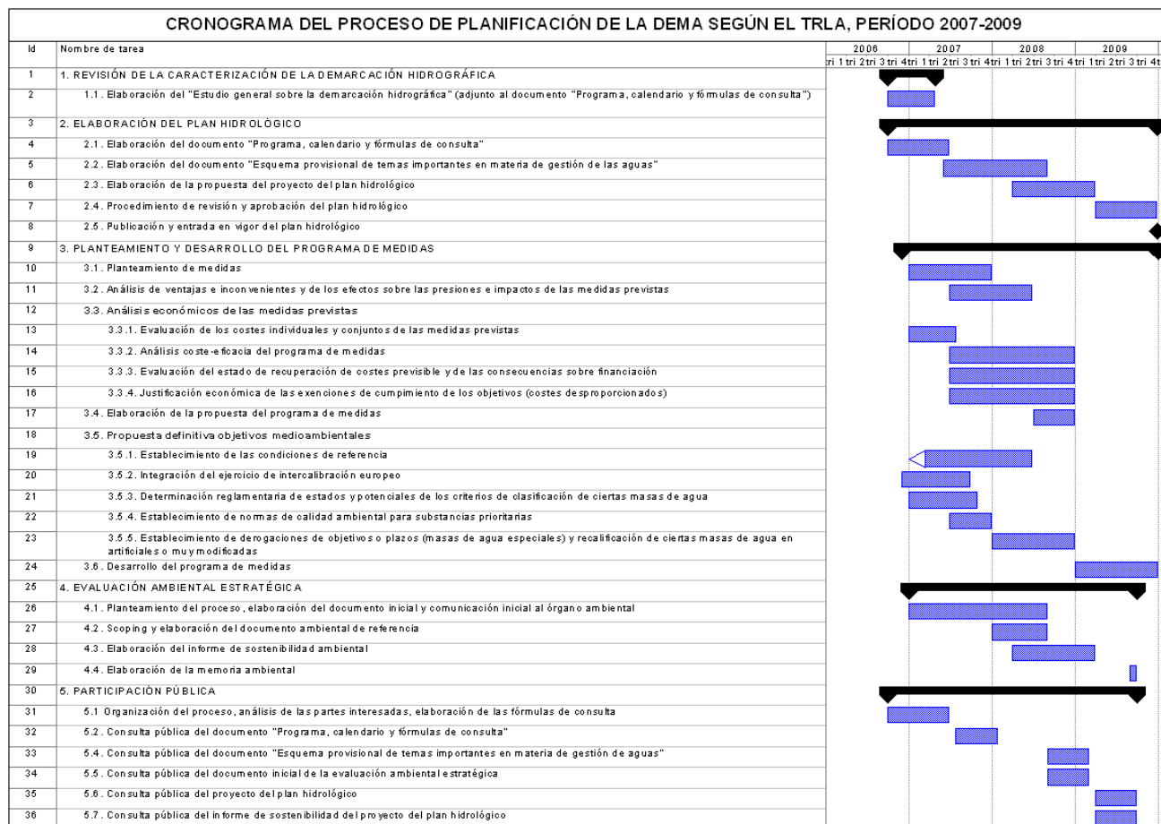
Figura 3: Identificación en el cronograma provisional de los procesos de participación pública (consulta pública y otras acciones para la participación activa)