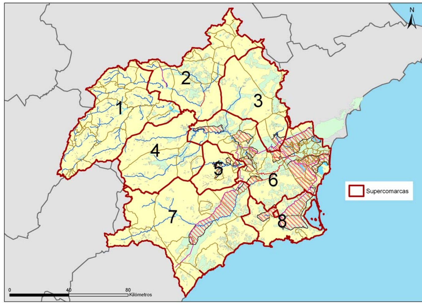
Figura 1: Agrupaciones de comarcas que servirán de base geográfica para el establecimiento de mesas sectoriales