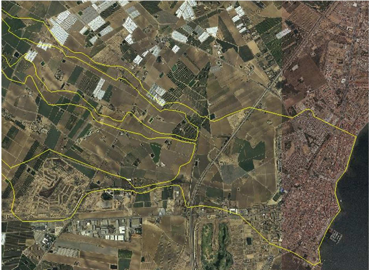
FIGURA 4. Detalle de ZFP de Maraña sin incluir flujos desbordados de La Colonia en Los Alcázares.

De esta cita cabe deducir que el planteamiento que presenta la propia CHS de la medida 1895 del PdM no ha sido suficientemente estudiado dada la situación que el propio encauzamiento del Albuñón, la configuración del trazado de la AP-7 y la propia configuración topográfica de la zona generarían a esta solución.