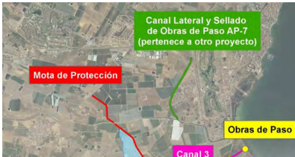
FIGURA 2. Detalle de la alternativa para la rambla del Albuñón en el PGRI.

que todo el caudal aguas arriba de la misma descienda hasta la rambla y no se produzcan inundaciones dentro en la zona de Bahía Bella.”