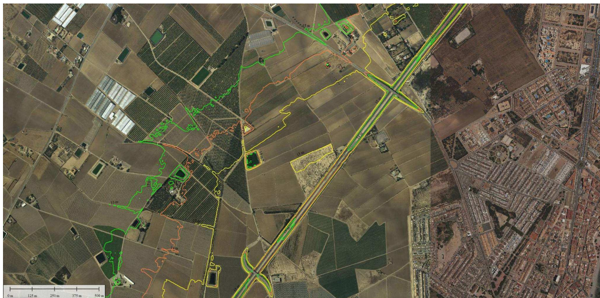
FIGURA 3. Líneas de nivel a cota 13, 14 y 15 metros

En la Memoria del PROYECTO PARA AUMENTAR LA CAPACIDAD HIDRÁULICA DEL DRENAJE AGRÍCOLA D-7 DEL CAMPO DE CARTAGENA. CANALIZACIÓN DE ESCORRENTÍAS EN LA AVENIDA FERNANDO MUÑOZ ZAMBUDIO Y ALEDAÑOS. T.M LOS ALCÁZARES (MURCIA), su punto 3.3 ESTUDIO DE SOLUCIONES cita literalmente: