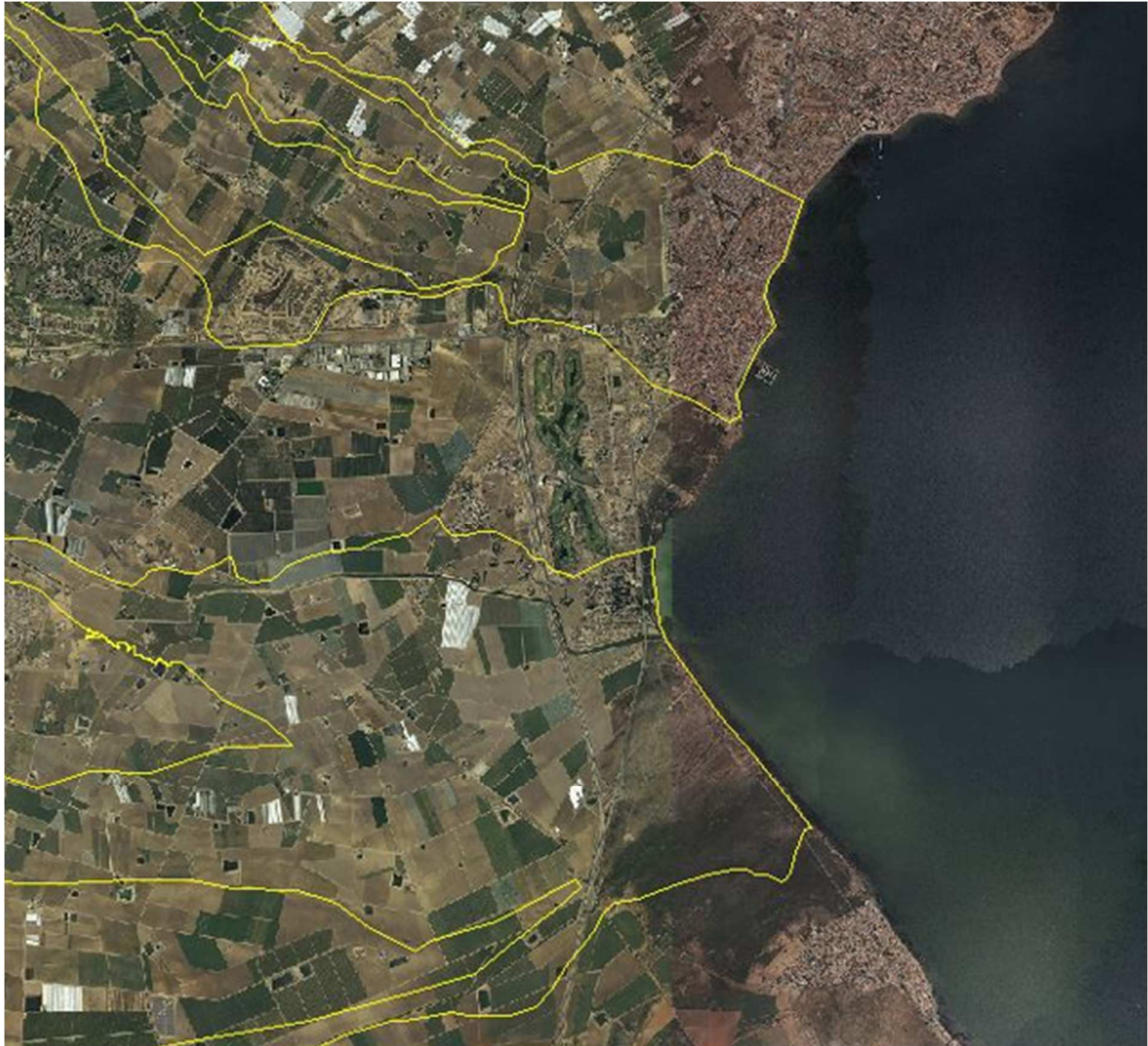
FIGURA 5. Zonas de flujo preferente de las ramblas de la Maraña y el Albuñón. Lomas de Rame no tiene afección de la rambla de la Maraña y apenas de la del Albuñón.