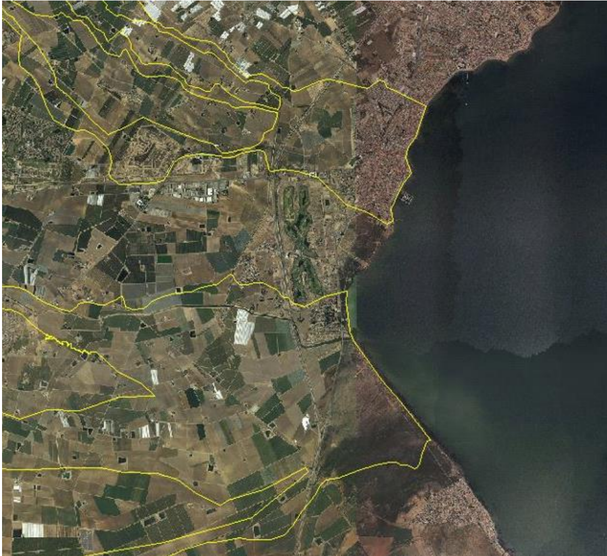
FIGURA 5. Zonas de flujo preferente de las ramblas de la Maraña y el Albujón. Lomas de Rame no tiene afección de la rambla de la Maraña y apenas de la del Albujón.