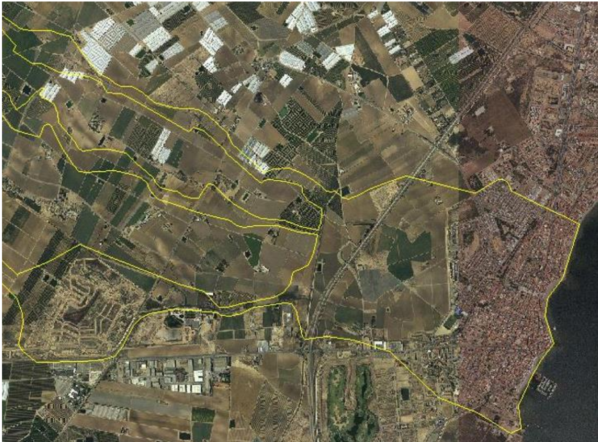
FIGURA 4. Detalle de ZFP de Maraña sin incluir flujos desbordados de La Colonia en Los Alcázares.

De esta cita cabe deducir que el planteamiento que presenta la propia CHS de la medida 1895 del PdM no ha sido suficientemente estudiado dada la situación que el propio encauzamiento del Albuñón, la configuración del trazado de la AP-7 y la propia configuración topográfica de la zona generarían a esta solución.