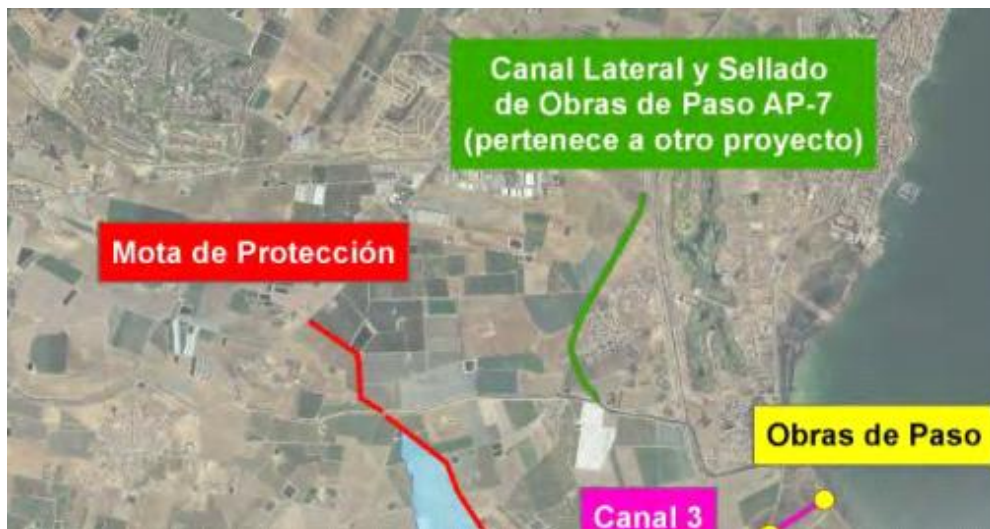
FIGURA 2. Detalle de la alternativa para la rambla del Albuñón en el PGRI.

...”Como actuaciones complementarias a las descritas, pero dentro del alcance de otro proyecto en redacción, se prevé la construcción de un canal paralelo a la carretera AP-7 que derive el caudal que aportan las ramblas del norte del municipio de Los Alcázares hacia el sur, de forma que desagüe al cauce existente de la rambla de Albuñón, añadiendo 67 m 3 /s. Como protección adicional se prevé la clausura de las obras de paso de la AP-7, de forma que todo el caudal aguas arriba de la misma descienda hasta la rambla y no se produzcan inundaciones dentro en la zona de Bahía Bella.”