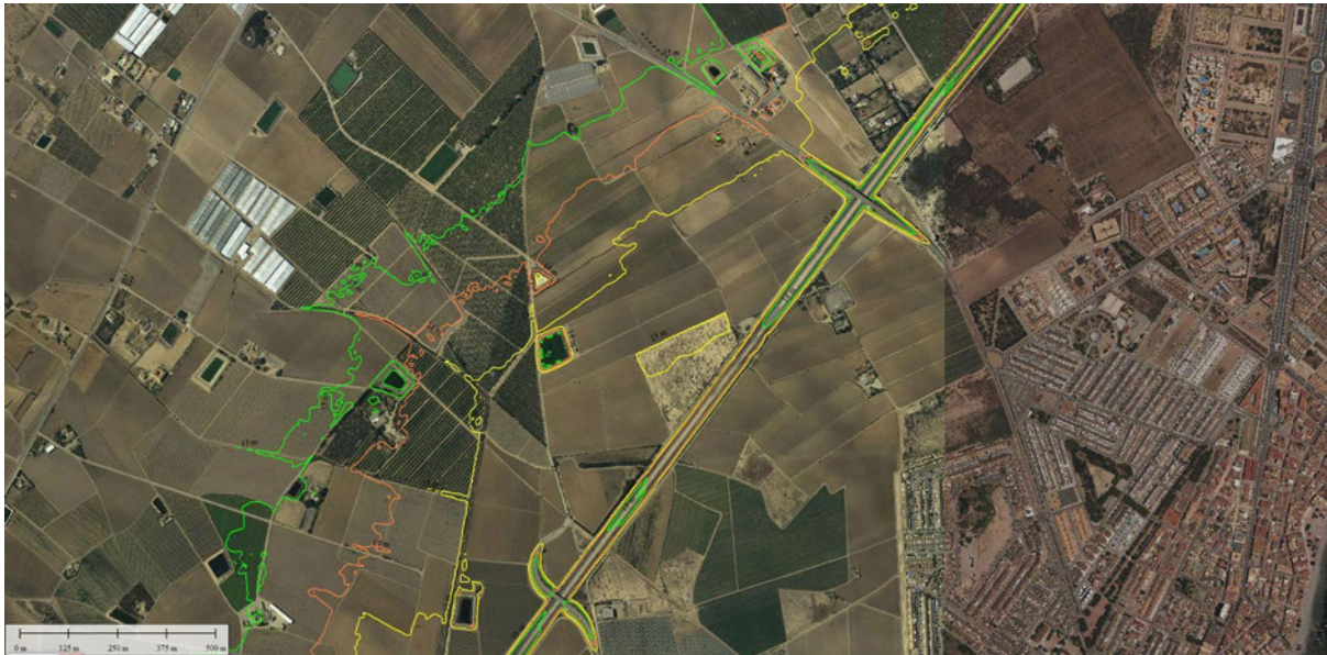
FIGURA 3. Líneas de nivel a cota 13, 14 y 15 metros

En la Memoria del PROYECTO PARA AUMENTAR LA CAPACIDAD HIDRÁULICA DEL DRENAJE AGRÍCOLA D-7 DEL CAMPO DE CARTAGENA. CANALIZACIÓN DE ESCORRENTÍAS EN LA AVENIDA FERNANDO MUÑOZ ZAMBUDIO Y ALEDAÑOS. T.M LOS ALCÁZARES (MURCIA), su punto 3.3 ESTUDIO DE SOLUCIONES cita literalmente: