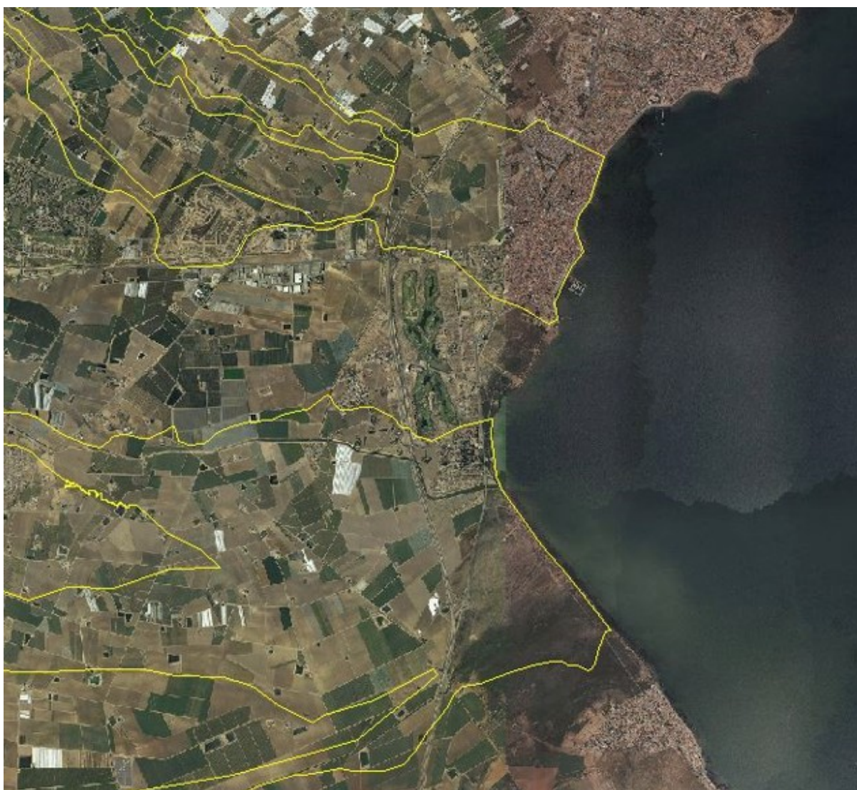
FIGURA 5. Zonas de flujo preferente de las ramblas de la Maraña y el Albuñón. Lomas de Rame no tiene afección de la rambla de la Maraña y apenas de la del Albuñón.