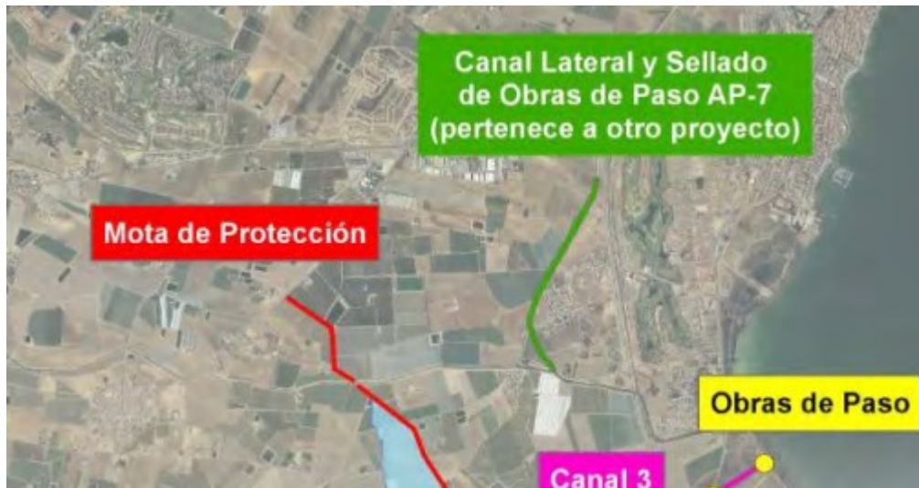
FIGURA 2. Detalle de la alternativa para la rambla del Albuñón en el PGRI.

que todo el caudal aguas arriba de la misma descienda hasta la rambla y no se produzcan inundaciones dentro en la zona de Bahía Bella.”