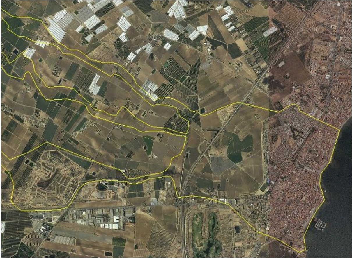
FIGURA 4. Detalle de ZFP de Maraña sin incluir flujos desbordados de La Colonia en Los Alcázares.

del Albuñón, la configuración del trazado de la AP-7 y la propia configuración topográfica de la zona generarían a esta solución.